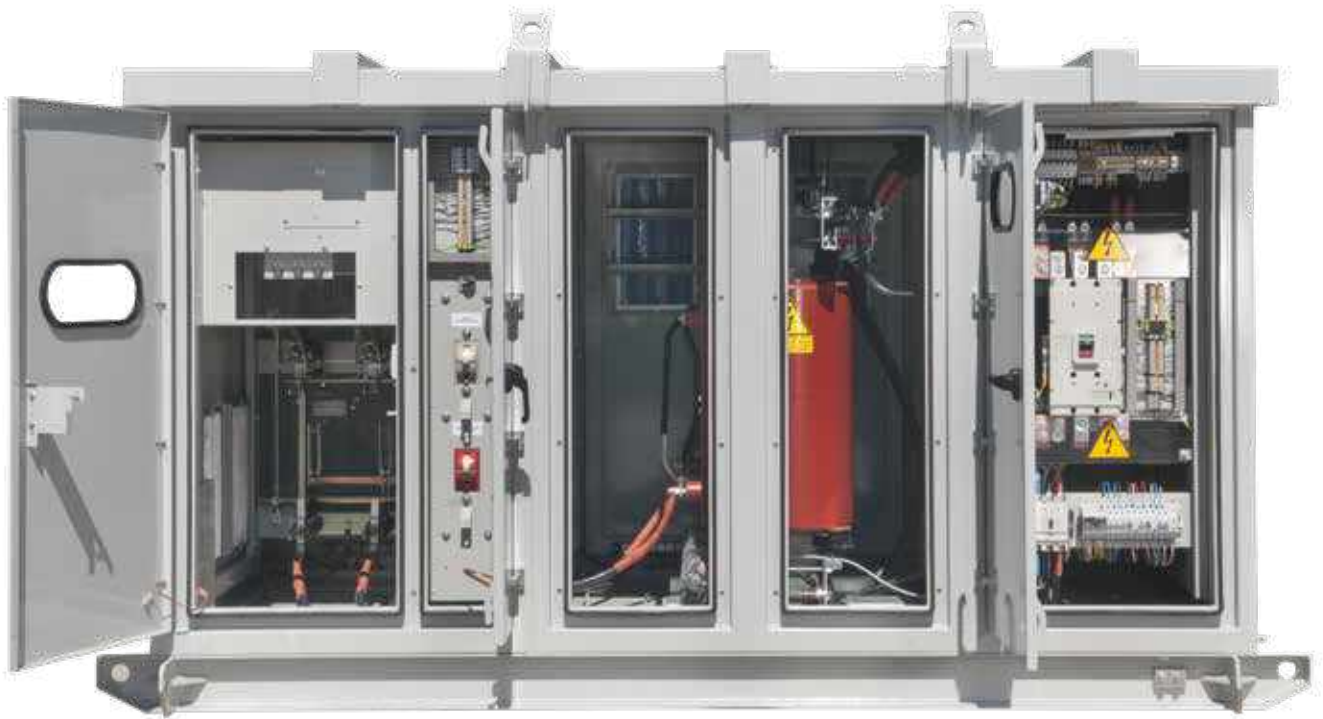
Subestación Interior Mina 500 kVA, 4.16 / 0.4 kV