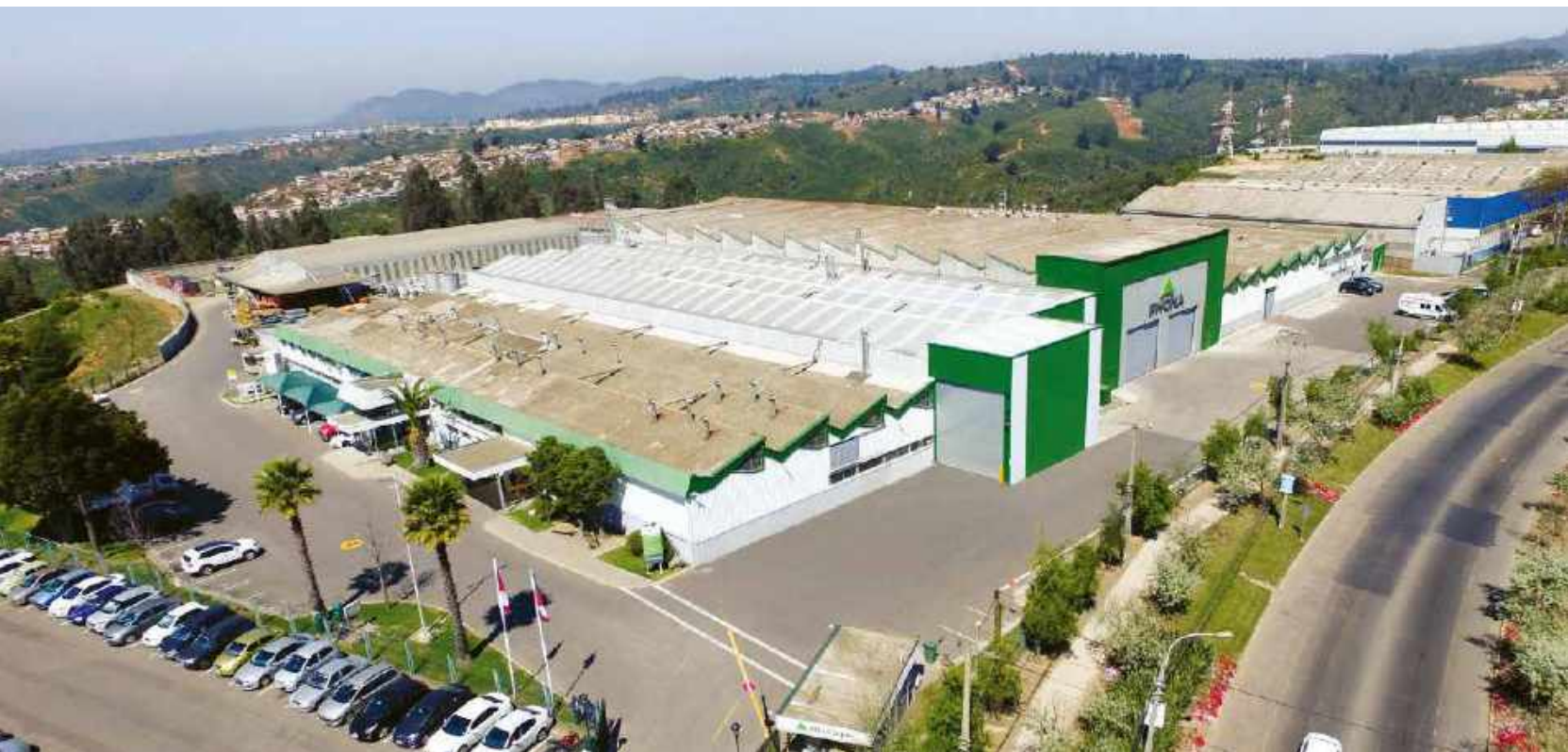
FÁBRICA RHONA VIÑA DEL MAR

Diseño, Fabricación, Reparación y Comercialización de Transformadores y Accionamientos Eléctricos