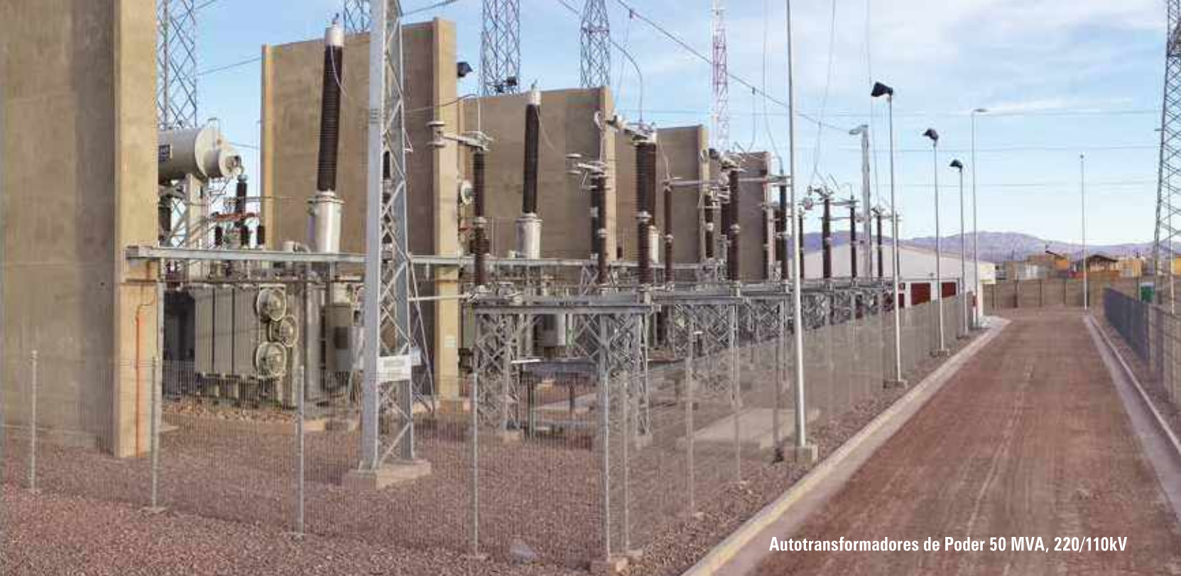
Autotransformadores de Poder 50 MVA, 220/110kV

Por medio de la alianza con importantes fábricas a nivel mundial, RHONA complementa su línea de transformadores de poder incluyendo equipos de hasta 1000 MVA y 750 kV, objeto de atender el creciente mercado regional en el segmento de 220 kV y principalmente 500 kV .